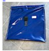
SAC de LEST Pour Structure Gonflable