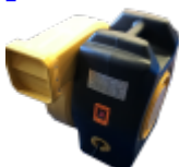
SOUFFLERIE/BLOWER Normes CE - 220v/16a - IP44 (nombre et puissance adaptée au jeu)