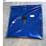
SAC de LEST Pour Structure Gonflable