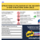
AFFICHAGE de SECURITE en 3 langues