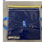
SAC de LEST Pour Structure Gonflable NEW!