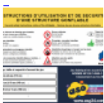
AFFICHAGE de SECURITE en 3 langues