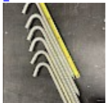
Crosses, Piquets d'ANCORAGE 42 cm