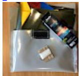
Kit REPARATIONS Structures Gonflables d ASG34