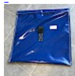
SAC de LEST Pour Structure Gonflable