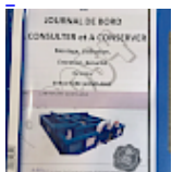
DOSSIER de Conformités & NOTICE d'Utilisation