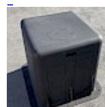
CAISSON INSONORISANT RIGIDE pour soufflerie