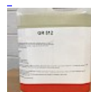
Nettoyant Structure Gonflable GR512