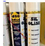
Lubrifiant Bombe pour la Glisse