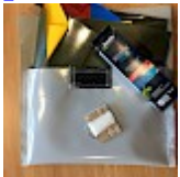
Kit REPARATIONS Structures Gonflables d ASG34