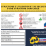
Panneau de SECURITE en 3 langues