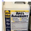
Anti-ADHÉRENT anti-FRICTION ASG34 Bidon