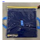
SAC de LEST Pour Structure Gonflable NEW!