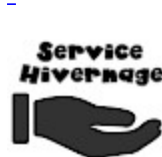
SERVICE ASG Hivernage Maintenance SAV