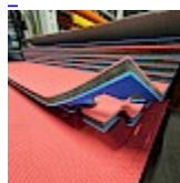
DALLE TAPIS de RÉCEPTION CLIPSABLE 2.1