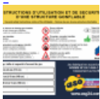
Panneau de SECURITE en 3 langues