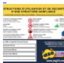
AFFICHAGE de SECURITE en 3 langues