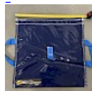
SAC de LEST Pour Structure Gonflable NEW!