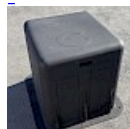
CAISSON INSONORISANT RIGIDE ASG34