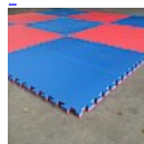
DALLE de RÉCEPTION CLIPSABLE 2.6