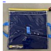
SAC de LEST Pour Structure Gonflable NEW!