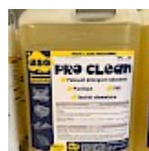
PRO CLEAN Nettoyant Spécial PVC