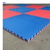
DALLE de RÉCEPTION CLIPSABLE 2.6