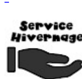
SERVICE ASG Hivernage Maintenance SAV