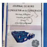
DOSSIER de Conformités & NOTICE d'Utilisation