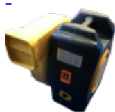
SOUFFLERIE/BLOWER Normes CE - 220v/16a - IP44 (nombre et puissance adaptée au jeu)