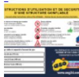
AFFICHAGE de SECURITE en 3 langues