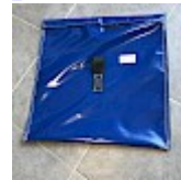
SAC de LEST Pour Structure Gonflable