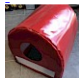
CAISSON de Protection SOUPLE pour soufflerie