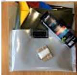
Kit REPARATIONS Structures Gonflables d ASG34