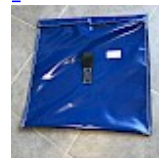
SAC de LEST Pour Structure Gonflable