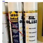
Lubrifiant Bombe pour la Glisse