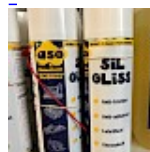
Lubrifiant Bombe pour la Glisse