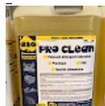
PRO CLEAN Nettoyant Spécial PVC