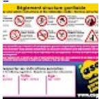
Panneau de SECURITE