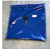
SAC de LEST Pour Structure Gonflable