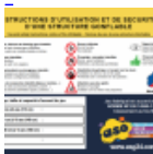
Panneau de SECURITE en 3 langues