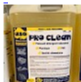
PRO CLEAN Nettoyant Spécial PVC