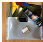
Kit REPARATIONS Structures Gonflables d ASG34