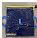
SAC de LEST Pour Structure Gonflable NEW!