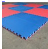
DALLE de RÉCEPTION CLIPSABLE 2.6