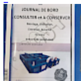
DOSSIER de Conformités & NOTICE d'Utilisation