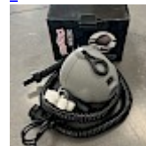
SOUFFLERIE / BLOWER AirTag