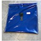
SAC de LEST Pour Structure Gonflable