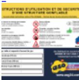
Panneau de SECURITE en 3 langues