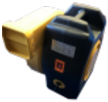
SOUFLERIE/BLOWER Normes CE - 220v/16a - IP44 (nombre et puissance adaptée au jeu)