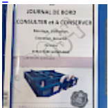
DOSSIER de Conformités & NOTICE d'Utilisation