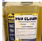
PRO CLEAN Nettoyant Spécial PVC