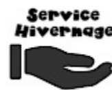
SERVICE ASG Hivernage Maintenance SAV