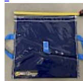
SAC de LEST Pour Structure Gonflable NEW!