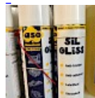
Lubrifiant Bombe pour la Glisse