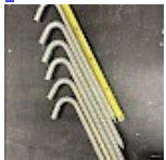
Crosses, Piquets d'ANCORAGE 42 cm