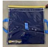
SAC de LEST Pour Structure Gonflable NEW!