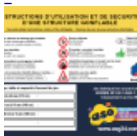
Panneau de SECURITE en 3 langues