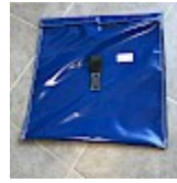
SAC de LEST Pour Structure Gonflable