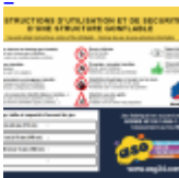
Panneau de SECURITE en 3 langues