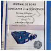
DOSSIER de Conformités & NOTICE d'Utilisation