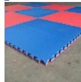
DALLE de RÉCEPTION CLIPSABLE 2.6