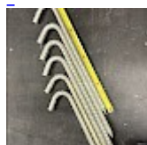
Crosses, Piquets d'ANCORAGE 42 cm