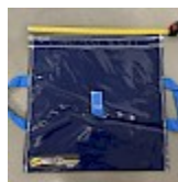
SAC de LEST Pour Structure Gonflable NEW!