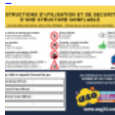
AFFICHAGE de SECURITE en 3 langues