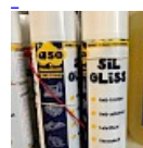
Lubrifiant Bombe pour la Glisse