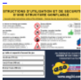
Panneau de SECURITE en 3 langues