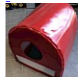
CAISSON de Protection SOUPLE pour soufflerie