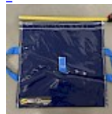
SAC de LEST Pour Structure Gonflable NEW!