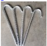
Piquets d'ANCORAGE 50