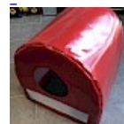
CAISSON de Protection SOUPLE pour soufflerie