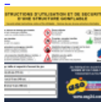
AFFICHAGE de SECURITE en 3 langues