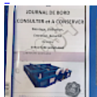
DOSSIER de Conformités & NOTICE d'Utilisation