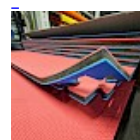
DALLE TAPIS de RÉCEPTION CLIPSABLE 2.1