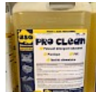
PRO CLEAN Nettoyant Spécial PVC