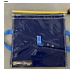
SAC de LEST Pour Structure Gonflable NEW!