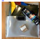
Kit REPARATIONS Structures Gonflables d ASG34