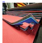
DALLE TAPIS de RÉCEPTION CLIPSABLE 2.1