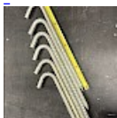
Crosses, Piquets d'ANCRAGE 42 cm