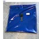
SAC de LEST Pour Structure Gonflable