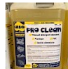
PRO CLEAN Nettoyant Spécial PVC