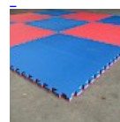
DALLE de RÉCEPTION CLIPSABLE 2.6