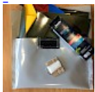
Kit REPARATIONS Structures Gonflables d ASG34