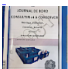
DOSSIER de Conformités & NOTICE d'Utilisation