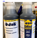
ODOR Parfum Gonflable