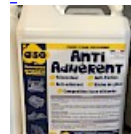
anti-ADHERENT anti-FRICTION ASG34 Bidon