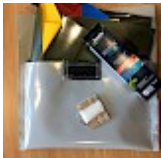
Kit REPARATIONS Structures Gonflables d'ASG34