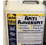
Anti-ADHÉRENT anti-FRICTION ASG34 Bidon