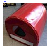
CAISSON de Protection SOUPLE pour soufflerie