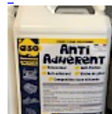
anti-ADHERENT anti-FRICTION ASG34 Bidon