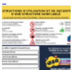
Panneau de SECURITE en 3 langues