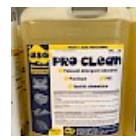
PRO CLEAN Nettoyant Spécial PVC