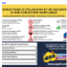
Panneau de SECURITE en 3 langues