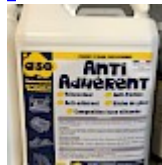
anti-ADHERENT anti-FRICTION ASG34 Bidon