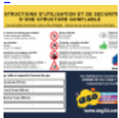
Panneau de SECURITE en 3 langues