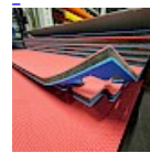
DALLE TAPIS de RÉCEPTION CLIPSABLE 2.1