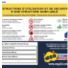
Panneau de SECURITE en 3 langues