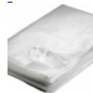
BACHE DE PROTECTION Pour Structure Gonflable 4/6/300grm 2